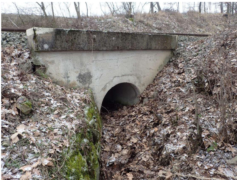
Foto 4: Částečná degradace levé části čela propustku, pravé křídlo pod vrstvou zeminy